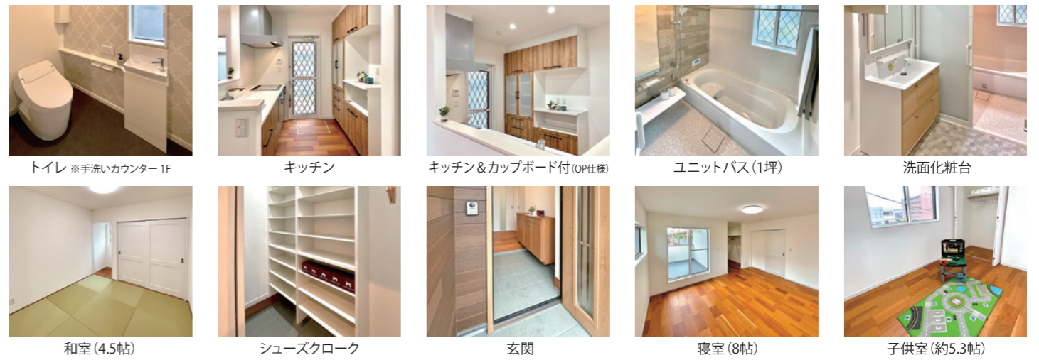
トイレ ※手洗いカウンター1F キッチン キッチン&カップボード付(OP仕様) ユニットバス(1坪) 洗面化粧台 和室(4.5帖) ※和紙畳(OP仕様) シューズクローク 玄関 寝室(8帖) 子供室(約5.3帖)